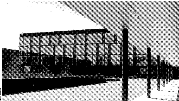
ECONOMIES L'établissement morglen est le mieux placé du canton, d'après l'élu, critère qui permet de vérifier si l'objectif budgétaire est respecté.

Forts de cette bonne note budgétaire, les enseignants relèvent la surcharge des effectifs de classes. Il semble que le problème se soit encore aggravé. «Le phénomène atteint maintenant les classes de terminale avec 25 ou 26 élèves. La moyenne est plus élevée ici qu'ailleurs dans le canton», décrit un maître désirant rester anonyme.