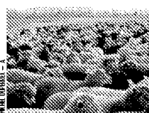
Les troupeaux de moutons sont interdits de séjour dans certaines communes.