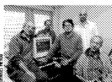
L'association AISP est née du regroupement des prestations de l'Ecole de cours préprofessionnels (ECP).

La structure est ouverte aux jeunes de 15 à 25 ans. Ils devront payer un écolage se montant à 1400 francs par mois, pris en