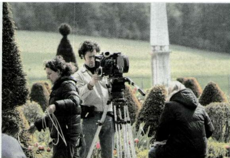
Wer in der Schweiz Filmregisseur werden will, muss mindestens fünf Jahre in die Ausbildung investieren. Ein Blick auf das Filmset von «Vitus».